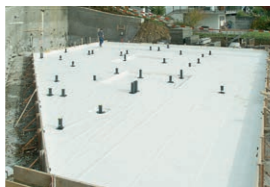
Abdichtung einer Bodenplatte mit Preprufe®