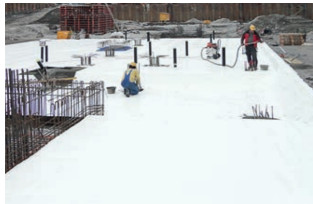
Das erweiterte Dichtungskonzept für die Dichtigkeitsklasse 1 mit dem neuen Injektionskanal Drytech Swiss System S3 und der Hightechflächenabdichtung Preprufe®.

Allfällige nachträgliche Verpressungen sind mit der 10-jährigen Garantieleistung vollumfänglich abgedeckt. Eine wichtige Voraussetzung dafür ist die Zugänglichkeit. Überall dort, wo die Zugänglichkeit nicht mehr gewährleistet ist, beispielsweise bei hochwertig ausgebauten Räumen, empfiehlt der Schweizerische Ingenieur- und Architektenverein SIA in seiner überarbeiteten Norm 272, neu die Dichtigkeitsklasse 1 anzuwenden.