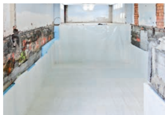
Abdichtung unter Bodenplatte und Unterfangung