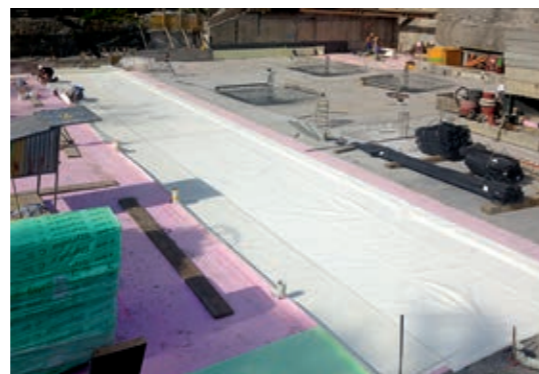
Partielle Flächenabdichtung, im Bild beispielsweise bei einem Treppenhaus