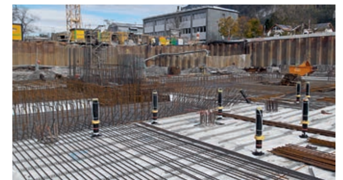
Problemlos und einfach kann die Armierung auf der Preprufe-Folie verlegt werden.

Bei Preprufe 800 PA handelt es sich um eine HDPE-Dichtungsbahn der neuen Generation mit synthetischer Klebtechnologie auf Basis der Preprufe Advanced Bond Technology™ von Grace. Preprufe 800 PA ist kompatibel mit den Preprufe Dichtungsbahnen 160 R/300 R und somit Bestandteil des Preprufe Abdichtungssystems.