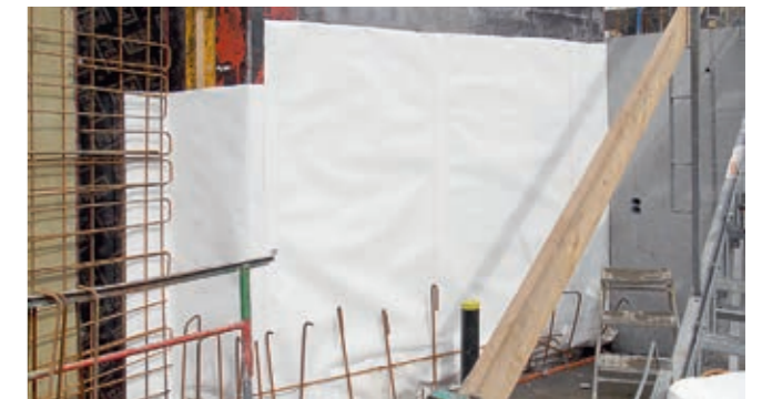
Wandflächenabdichtung zum Beispiel bei Schlitzwänden oder Unterfangungen.