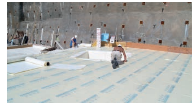
Verlegen der Preprufe-Folie auf einer Bodenplatte