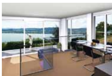
Minergiebau, Überbauung Meilen