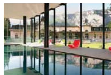
Wellnessanlage Hotel Waldhaus, Flims

Rufen Sie uns an. Gerne beraten wir Sie unverbindlich und stellen Ihnen unsere Neuentwicklung vor.